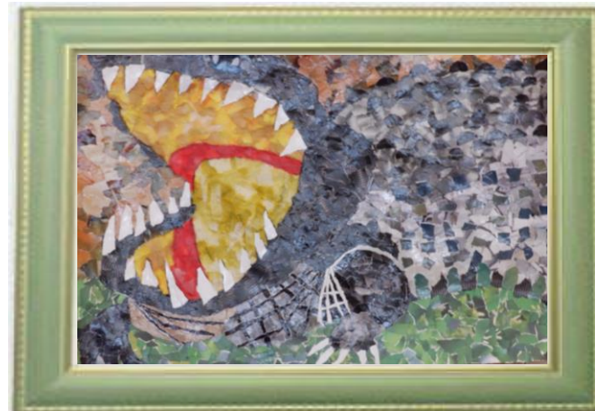
ちぎり絵の部 作品応募用紙 中原区 題名 お代わり ちょうだい！ 学年 3 氏名 西村 恒星 男 住所 山王町一丁目