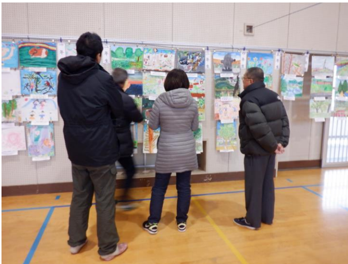
絵画 ちぎり絵は これで 全部