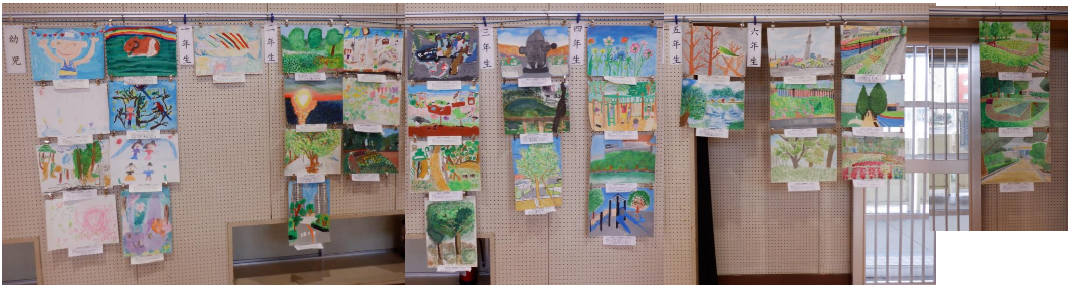
絵画 これで 全部です