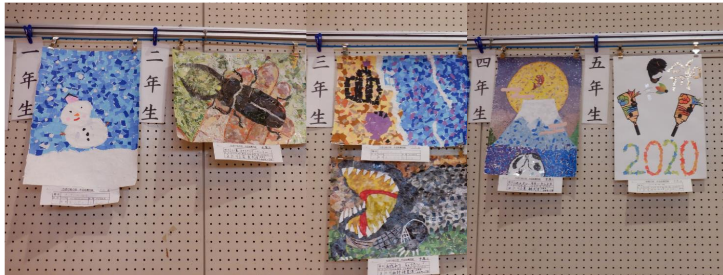
ちぎり絵の部門はこれで全部です