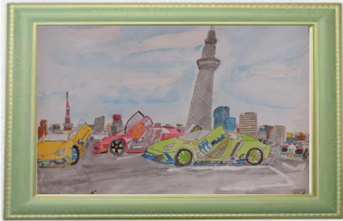
絵画の部 作品応募用紙 中原区 題名 楽しいドライブ 学年 6 氏名 春藤 恒太 男 住所 山王町一丁目