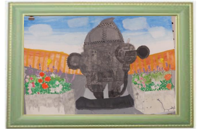
絵画の部 作品応募用紙 中原区 題名 トーマスと花の園 学年 6 氏名 井澤 聖莉 女 住所 山王町一丁目