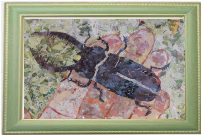
ちぎり絵の部 作品応募用紙 中原区 題名 ツノ男.チクチクして いよいよ～ 学年 2 氏名 三宅 良太 男 住所 山王町一丁目