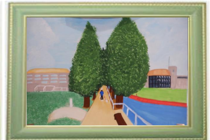
絵画の部 作品応募用紙 中原区 題名 緑の並木道 学年 6 氏名 平野 聖奈 女 住所 山王町一丁目