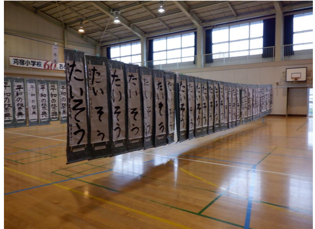
書道の作品 この 2列のみ 2列目の裏側が 下のようになります。

表彰式 令和2年3月1日 (日) 会場: 高津市民館12階 大会議室 (溝口駅前丸井ビル内) 展1:00より